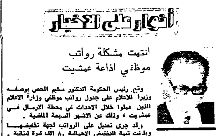
انتبهت مشكلة رواتب موظفي اذاعة عمشيت

واضاف: ان صيغة 19٤٢ ولت لفرجة، وقد أكل الدهر عليها، وشرب، نغمة الجوز وليس من الكفاءة بشيء ان يجوز التفكير بها او باحياؤها، لان السنوات التي مرت منذ عام 19٤٢ حتى اليوم اثبتت واكثرت فشلاً، ولعلنا نعلم اليوم صيغة جديدة أكثر واقعية، وتوفر الأمن، والحرية والسلام لكل اللبنانيين.